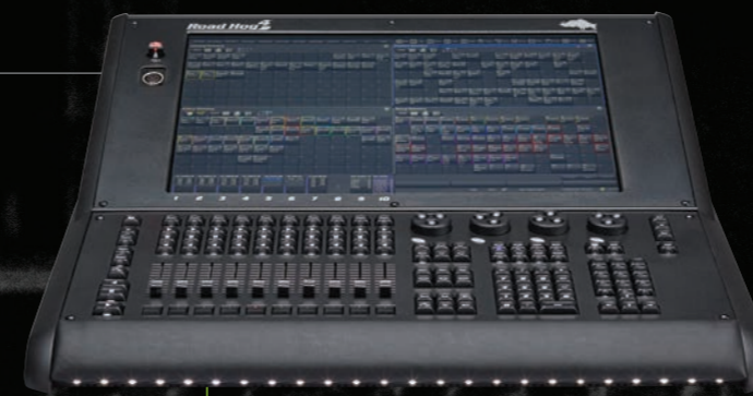
Road Hog 4

Пользователи оценят 22-дюймовый тач-экран с высоким разрешением и достаточным пространством для создания индивидуального отображения информации. Один дополнительный внешний монитор обеспечит прямой доступ без лишних действий.