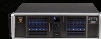
Rack Hog 4

Rack Hog 4 также может являться системой резервирования для любого пульта линейки Hog.