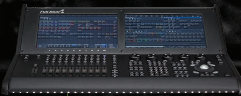
Full Boar 4

Full Boar 4 имеет два встроенных 15-дюймовых тач-экрана, а также поддерживает до двух внешних тач-мониторов. Full Boar 4 удовлетворит даже самого требовательного оператора, а также сэкономит часть бюджета.